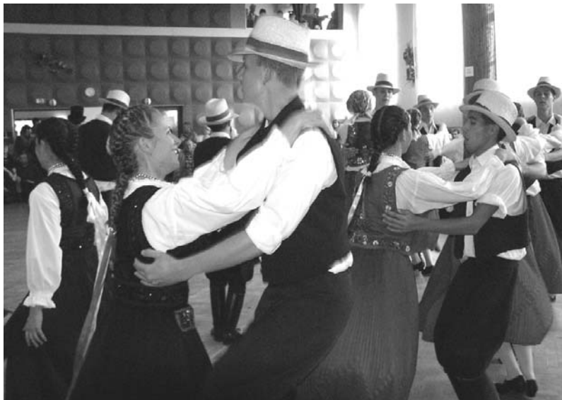
Maďarský národopisný soubor Tőköl sklidil velký úspěch se svými chorvatskými lidovými tanci.