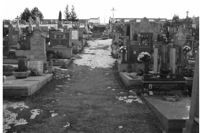
Některé části hlohoveckého hřbitova už po opravě vyložené volají. Zeď se na některých místech zhroutila a stala se nebezpečnou. Hlavní cesta mezi hroby by si zasloužila celkovou rekonstrukci a osvětlení.