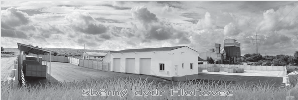
Sběrný dvůr Hlohovec

Sběrný dvůr nyní odpovídá všem požadavkům Evropské unie i Jihomoravského kraje.