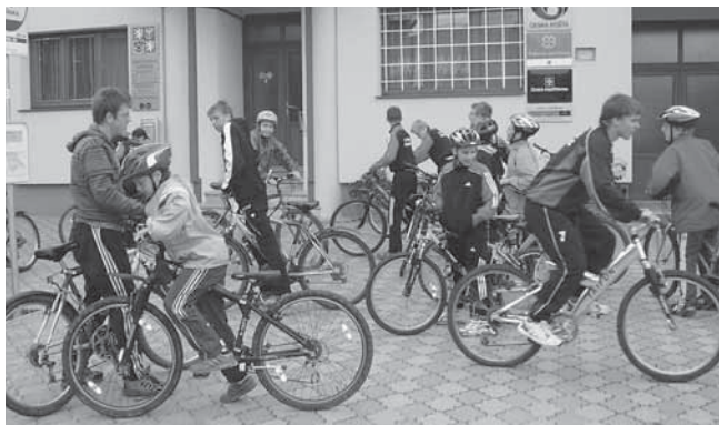
Na soustředění v Radějově mladí hlohovečtí fotbalisté najezdili kolem 70 kilometrů.

Chtěl bych touto cestou poděkovat všem rodičům, kteří tím, že své odměny za cestovné k zápasům nechávali klukům v jejich kase, utvořili základ pro uskutečnění tohoto soustředění. Dále pak panu Zdeňku Garčovicovi za zajištění chaty a panu Josefu Nejezchlebovi, který nám připravil kola. Zbylé náklady byly hrazeny z pokladny Sokola.