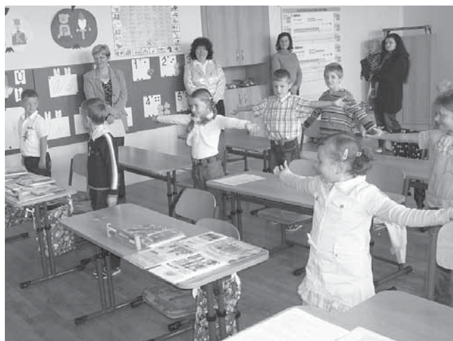
Letošní prvňáčci při zahájení školního roku.