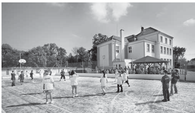
Rekonstrukce základní školy přinesla i vybavení školního dvora. Venkovní víceúčelové hřiště s umělou trávou může za jistých podmínek sloužit nejen školní mládeži, ale také veřejnosti.

Inženýrské sítě byly celkově budovány z 85,8% ze získaných dotací a úhrad nákladů třetími osobami. Vyšší finanční zatížení rozpočtu obce výstavbou inženýrských sítí se promítlo do ceny pozemků v ulici K zámečku a peníze se opět vrátí do rozpočtu obce po prodeji těchto pozemků. Položky uvedené v rastru jsou investice řešené správci sítí ve vlastní režii řešené na objednávku obce.