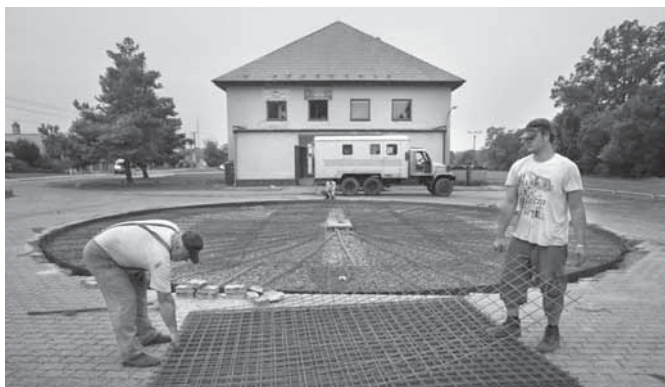
Úpravy kolem kulturního domu.