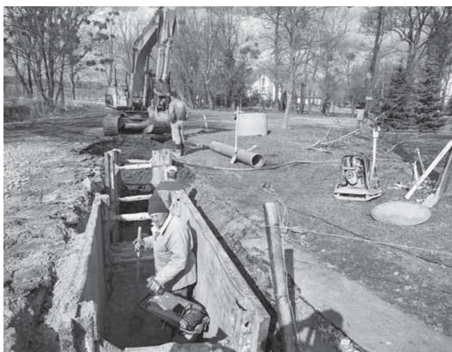
Výstavba inženýrských sítí v ulici K zámečku prověřila díky složitým klimatickým podmínkám letošního jara a léta připravenost investora i dodavatele, jímž byla společnost VHS Břeclav.