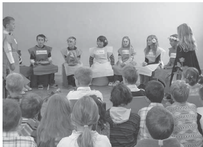
Při zahájení školního roku zhlédli školáci pohádku v podání svých spolužáků.